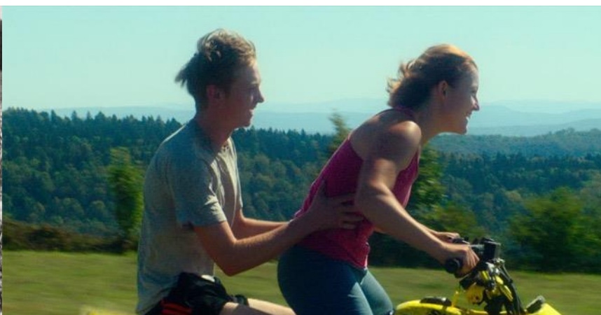
Images: «Quand nous étions petits enfants», Henry Brandt, 1961 / «Vingt Dieux », Louise Courvoisier, 2024